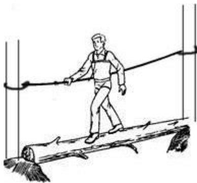
Переправа по бревну

Действия: первый участник проходит по бревну с концом веревки, крепит конец веревки к опоре. Остальные участники организуют перила натянув и закрепив веревку на опоре, если опоры один или двое удерживают в натянутом состоянии пока участники переправляются. Последний участник переправляется как первый