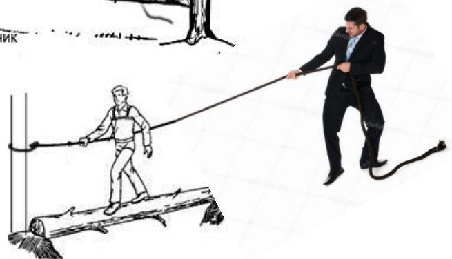
Переправа по бревну